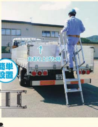
■ 背面あおりに設置