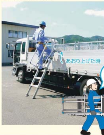
■ 側面あおりに設置