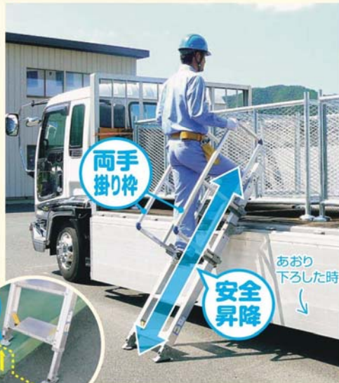
■ 側面あおりを倒して設置