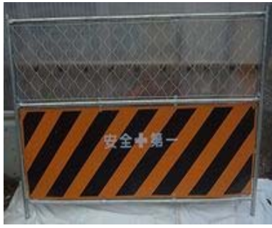
(W)1,800 × (H)1,200 (mm)