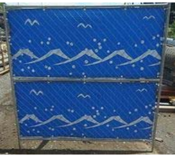
(W)1,800 × (H)1,800