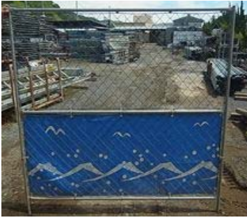
(W)1,800 × (H)1,800