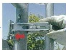
下部固定金具の先端の孔にクサビを差し込む