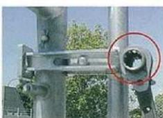
クサビ後部をハンマー等で叩く ※叩き込みすぎ注意