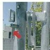
クサビを回転する

下部固定金具に建地があったら、下部固定金具のクサビをセットしハンマー等で2～3回打ち込みます。