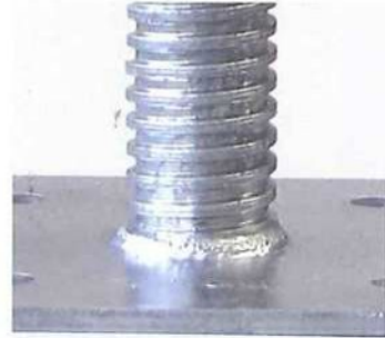
耐食性に優れた溶融亜鉛メッキ仕上げ