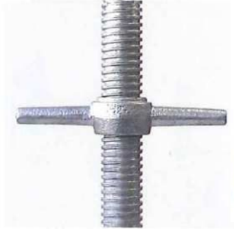
操作しやすい丸ハンドル設計