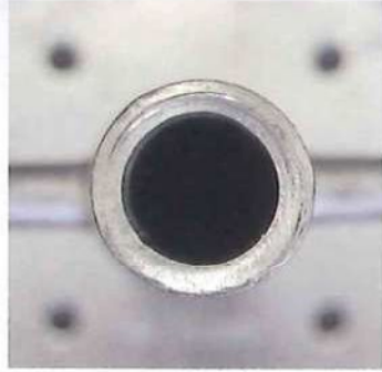
中空ねじ棒採用により軽量化を実現