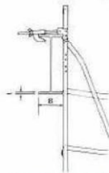
取付金具の規格(鉄製) (単位:mm)