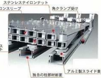
ステンレス 投付ボルト