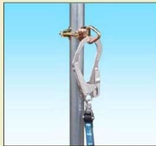
単管 + 安全帯