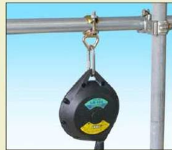
単管 + ライフブロック