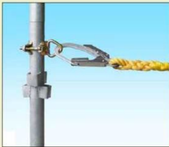
一側足場 + 親綱

φ42.7/48.6の単管、枠組/一側足場に取り付けて、親綱の展張用アンカーやライフブロック、チェンブロック、滑車などの吊下げ用金具としてお使いください。